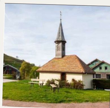
La Chapelle du Brabant

Location de poussettes tout terrain à la résidence "Le Couarôge" (vallée de Vologne).