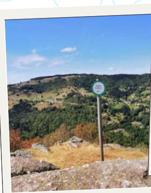
Roche du Minuit