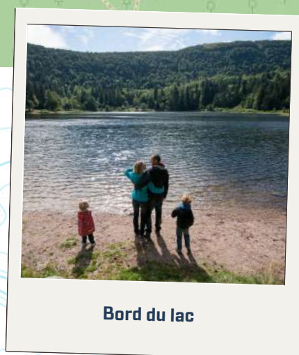
Bord du lac

Location de poussettes tout terrain à la résidence "Le Couarôge" (vallée de Vologne).