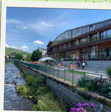
Maison de La Bresse